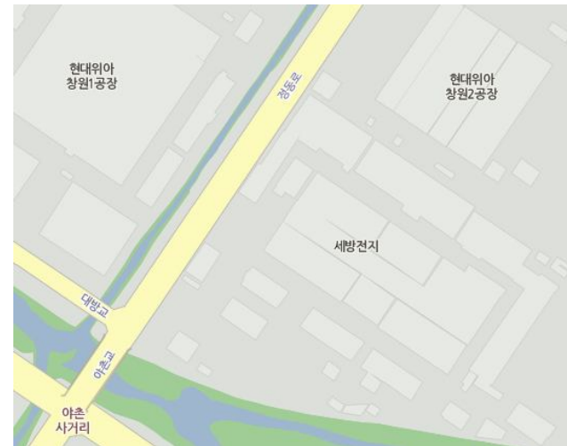
창원공장: 경상남도 창원시 성산구 정동로 122