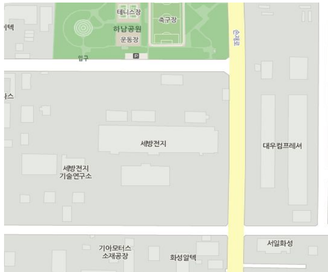
광주공장: 광주광역시 광산구 손재로 287