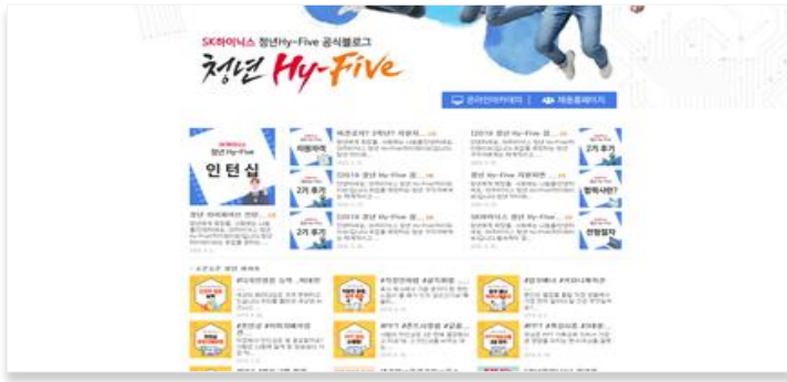
공식 블로그 (네이버)